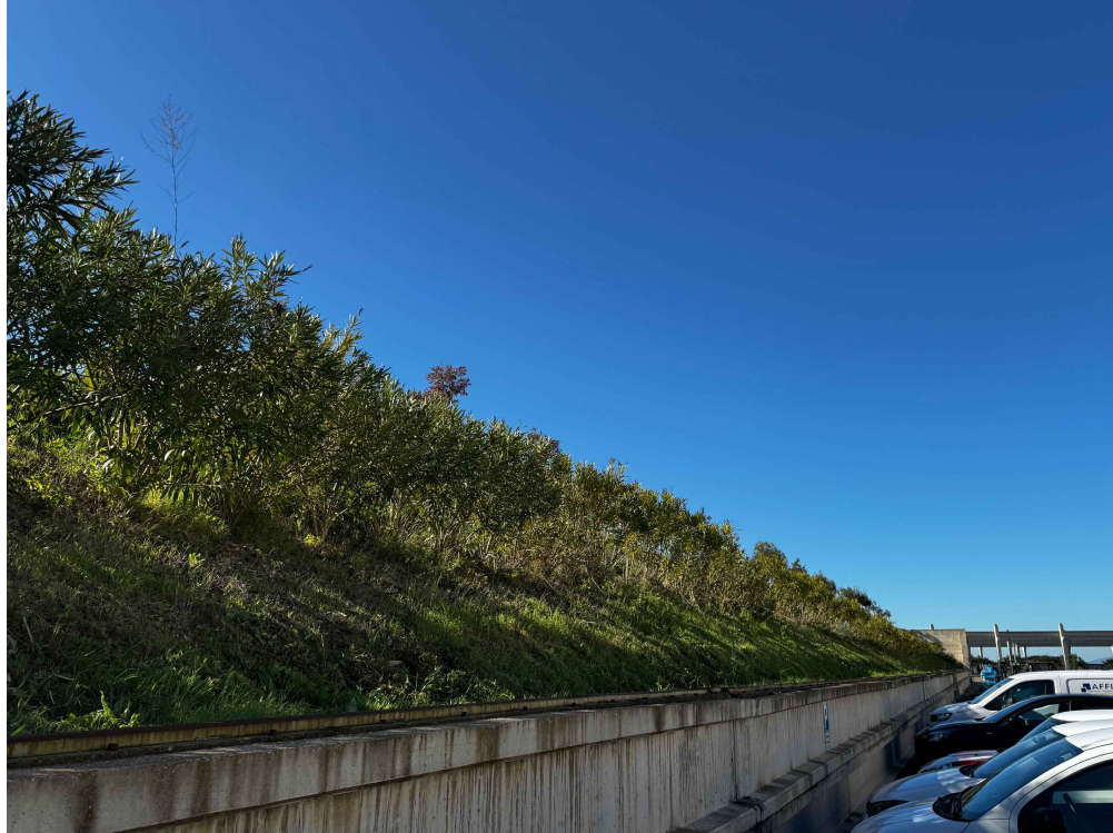
PUNTO DI VISTA 4