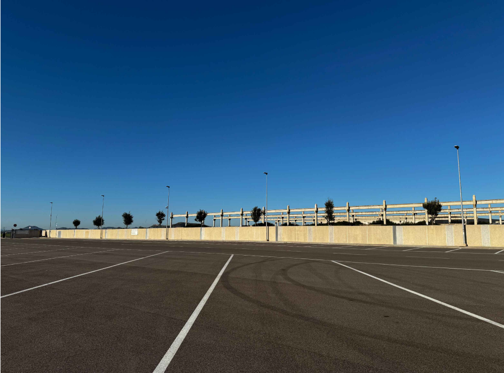
PUNTO DI VISTA 7