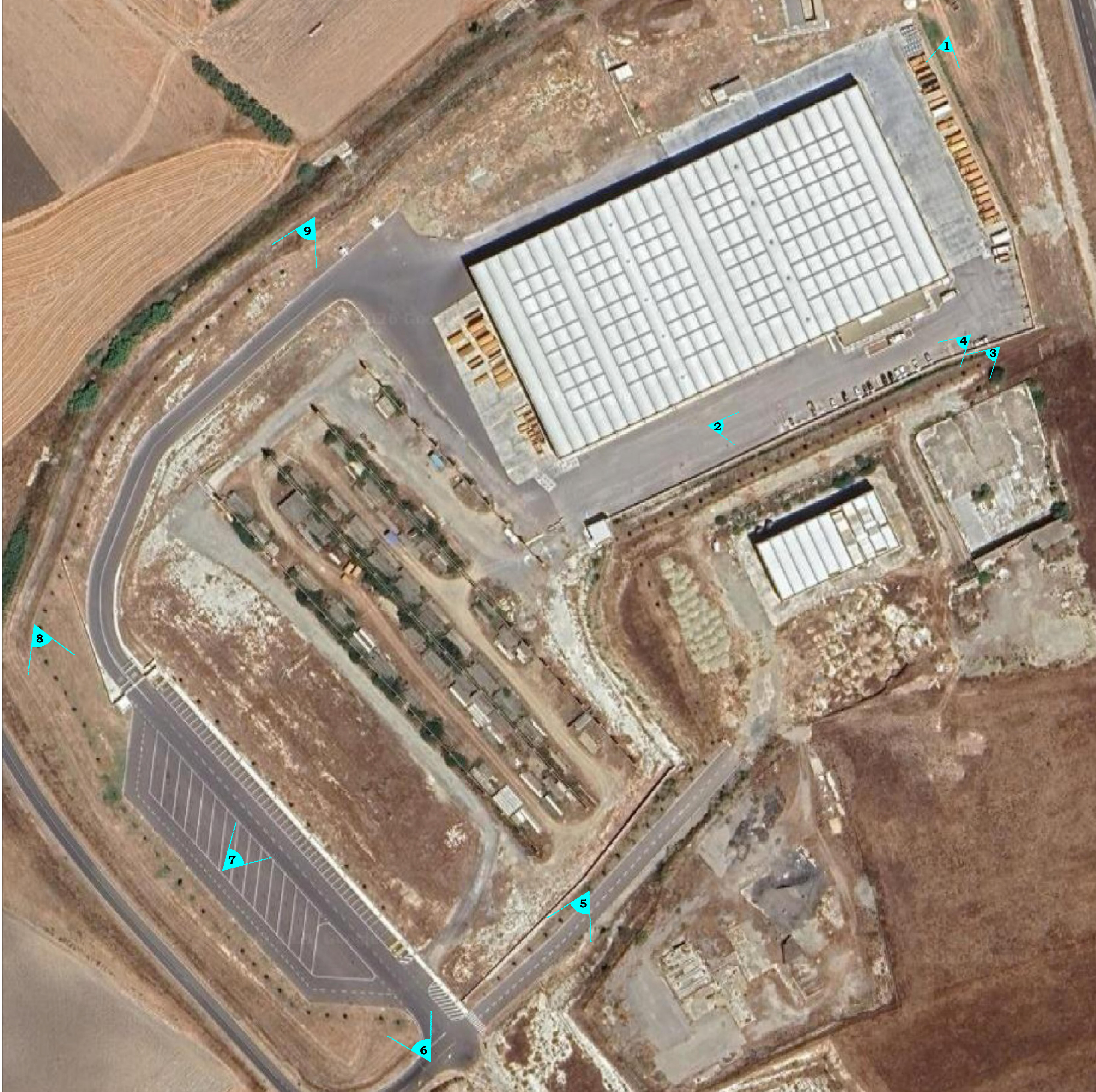
PLANIMETRIA CON PUNTI DI SCATTO