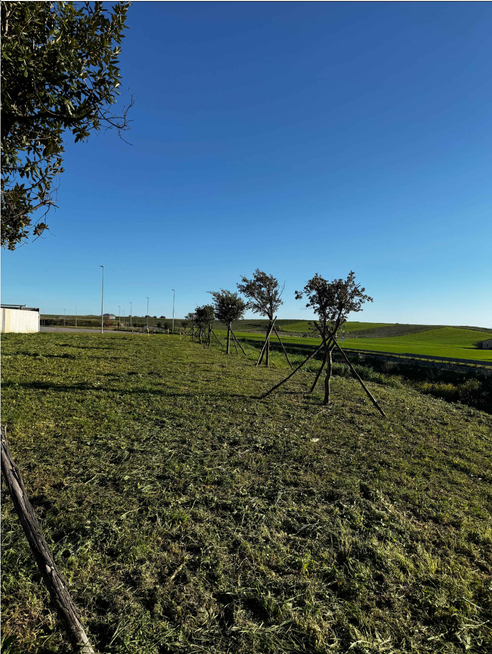
PUNTO DI VISTA 7