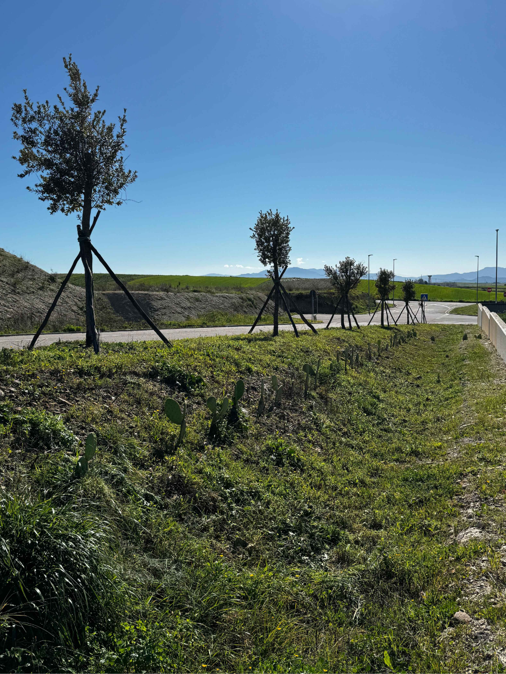
PUNTO DI VISTA 5