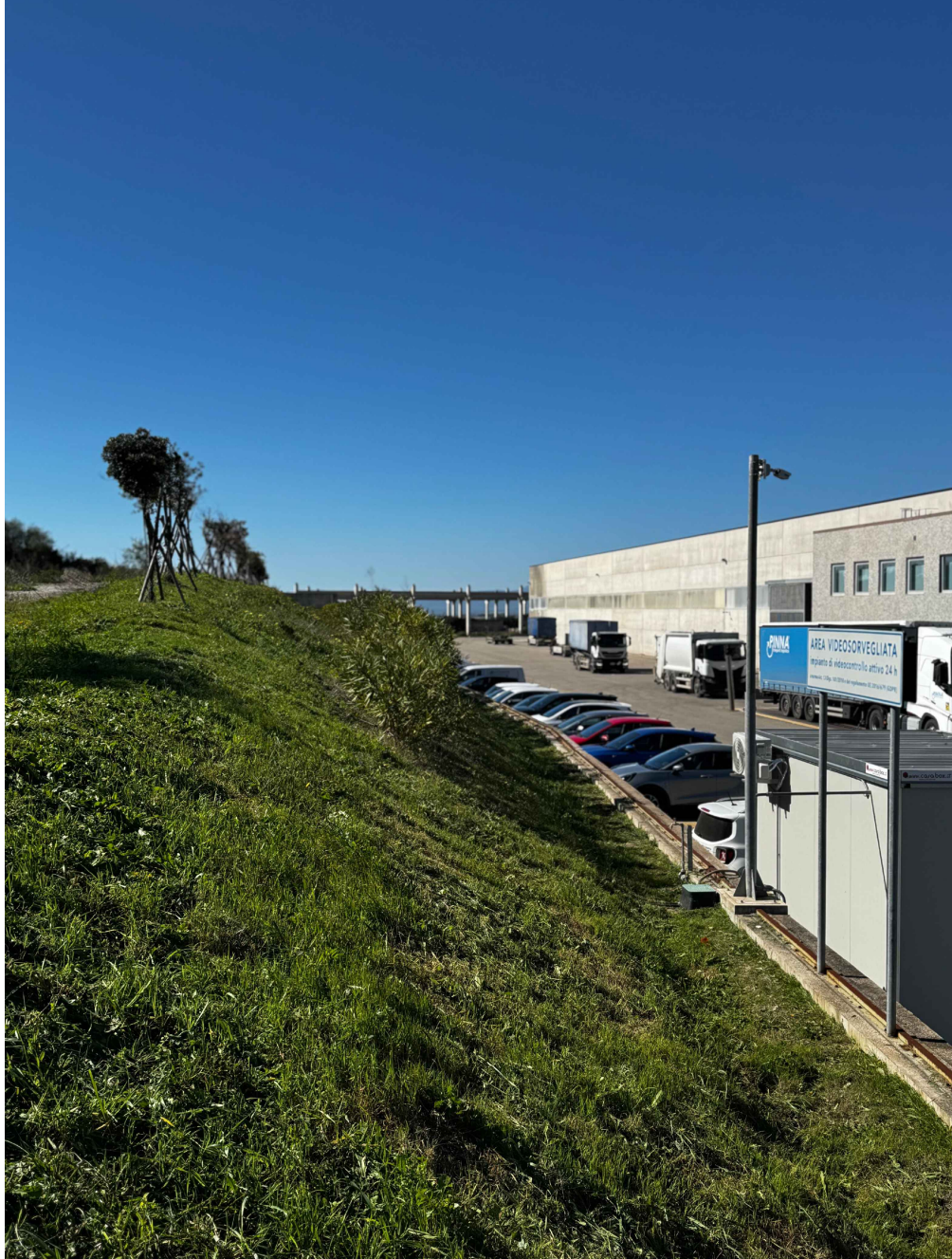
PUNTO DI VISTA 3